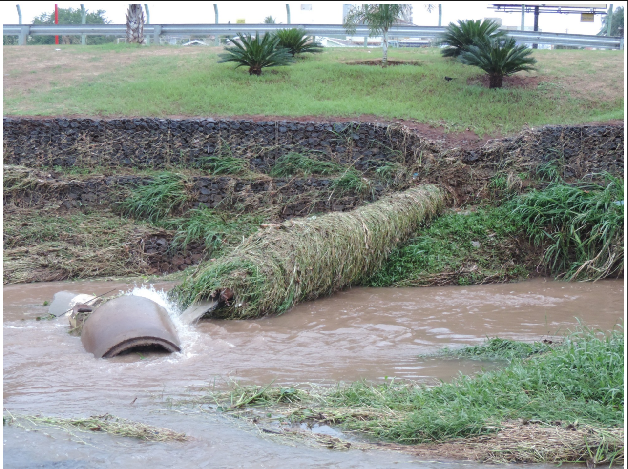
Descrição: Tubulação de esgoto rompida